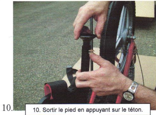
10. Sortir le pied en appuyant sur le téton.