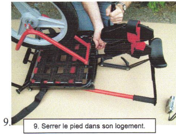
9. Serrer le pied dans son logement.