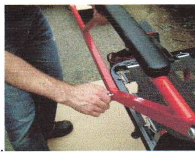
15. ... sur assise ...