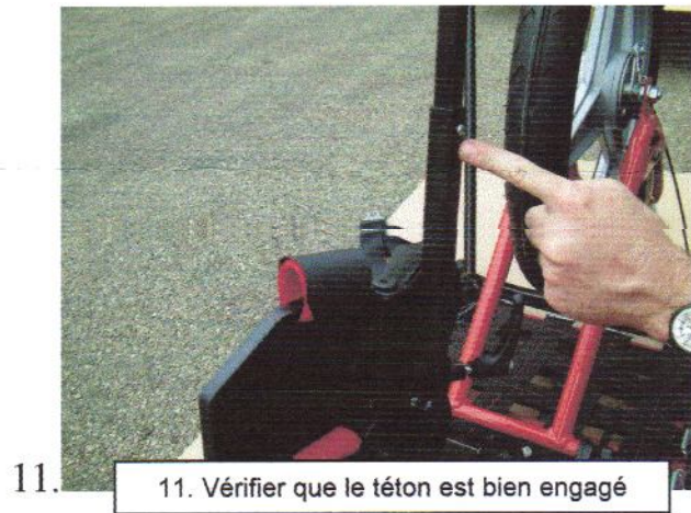
11. Vérifier que le téton est bien engagé