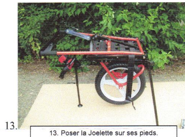
13. Poser la Joelette sur ses pieds.