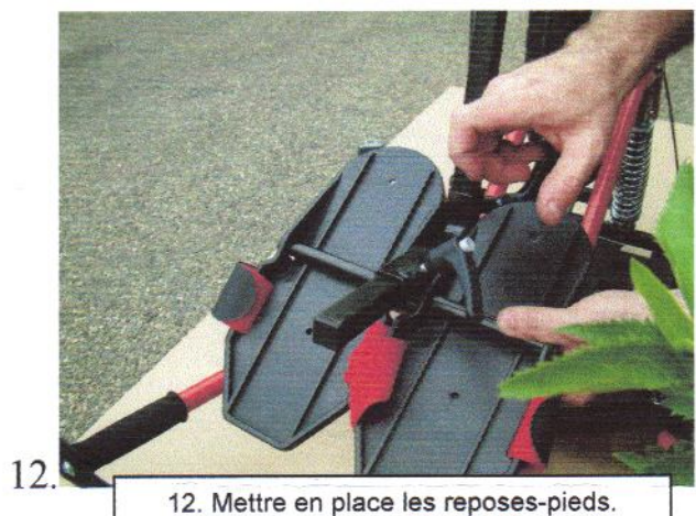
12. Mettre en place les repose-pieds.