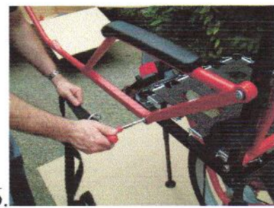
16. Serrer les vis avec la clé livrée.

Pour le repliage procéder en sens inverse.