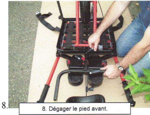
8. Dégager le pied avant.